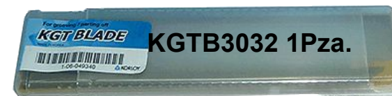
KG TB3032 1Pza.